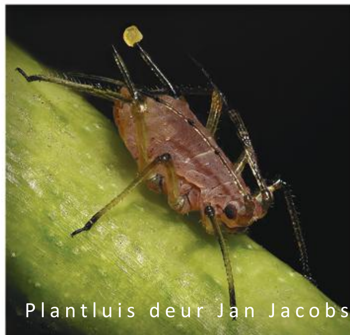
Plantluis deur Jan Jacobs