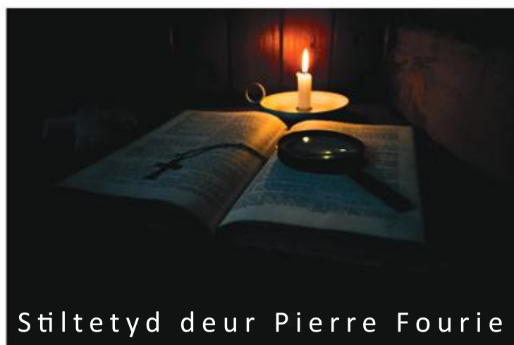
Stiltetyd deur Pierre Fourie