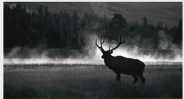
Elk in Mist - the title must stay the same when converting from colour to mono