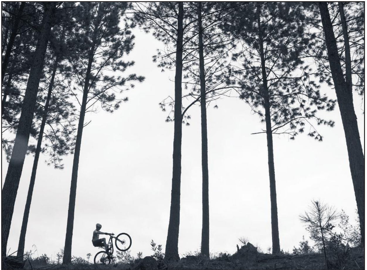
Mauritz Faling (2 Ster) se "Tussen die bome".