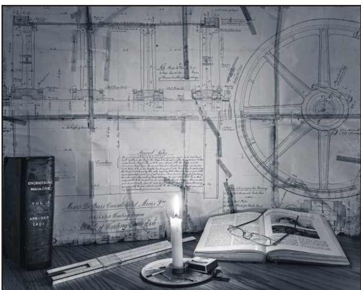
Neville Hein se "1900 Swaaringenieurswese".