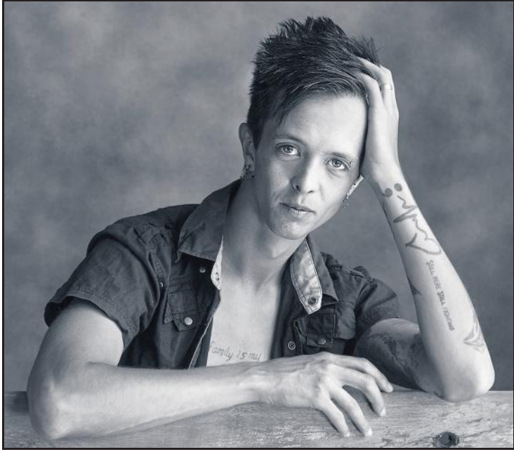
Koos Fourie se monochroom foto "Tatoo man".

Die Vanderbijlparkse Fotografiese Vereniging het onlangs sy maandelikse kluboggend onder Corona-virus protokol reëls gehou. Die maandtema was Tegnologie .