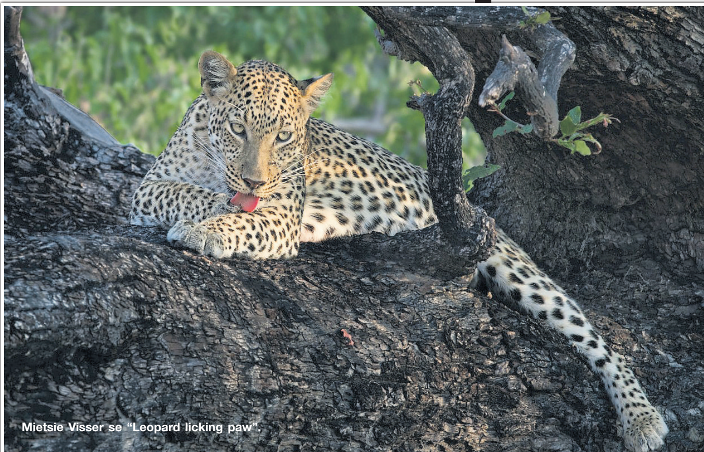
Mietsie Visser se “Leopard licking paw”.

Die Vanderbijlparkse Fotografiese Vereniging se tema vir September was “Natuur”. In ‘n land soos Suid-Afrika met al die nasionale bewaringsgebiede is natuurfoto’s ‘n gewilde genre en is die standaard van nature hoog.