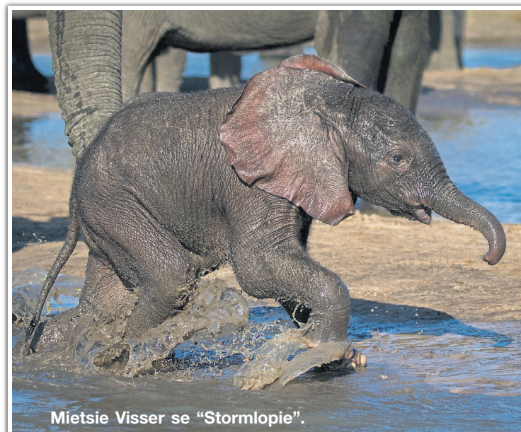
Mietsie Visser se “Stormlopie”.