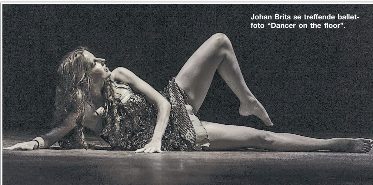
Johan Brits se treffende balletfoto “Dancer on the floor”.